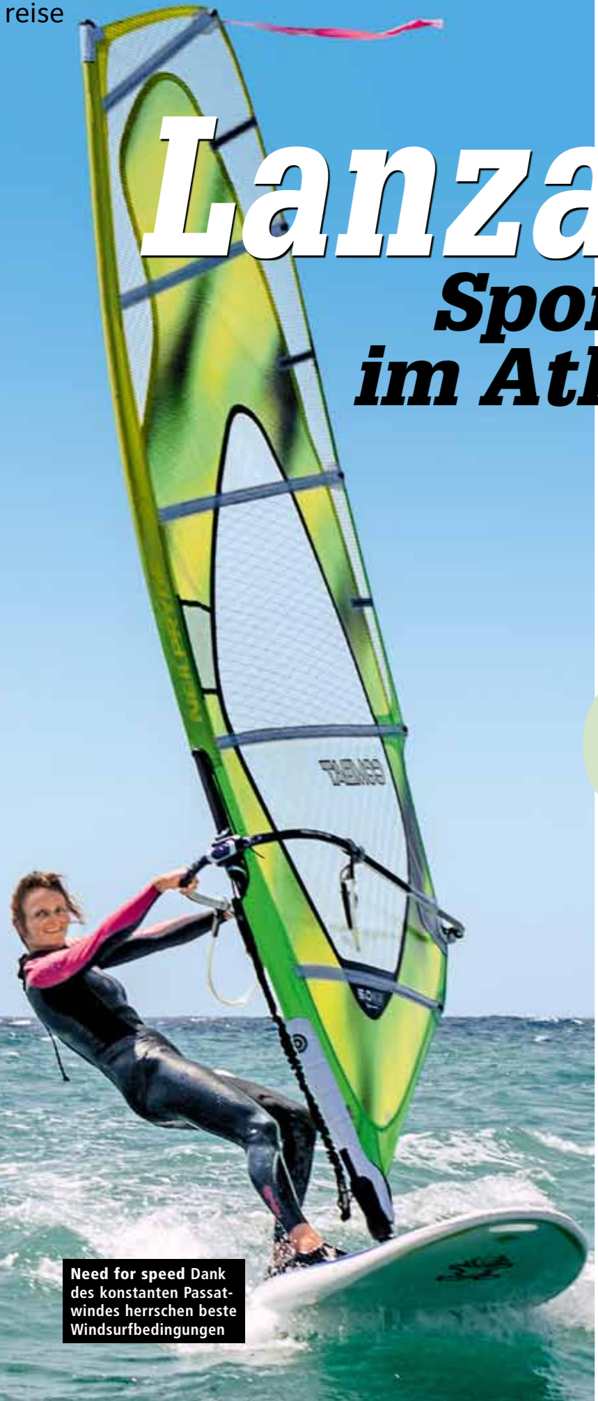
Need for speed Dank des konstanten Passatwindes herrschen beste Windsurfbedingungen

das Meer gleitet im Zeitraffer unter meinem Board hindurch und ich bin im Flow. Der Wind weht hier äußerst zuverlässig, deshalb ist zur Sicherheit ein Motorboot der Surfschule unterwegs, das Surfer im Notfall einsammelt. Den Rest des Tages verbringe ich entspannt an dem weißen, künstlich angelegten Sandstrand. Erst am Abend raffte ich mich noch zu einer Pilates-Stunde im