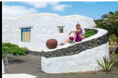
Originelle Architektur Alte Häuser wurden auf La Graciosa zu schmucken Ferienhäusern renoviert

führt, bin ich überwältigt von der Farbenvielfalt, die Vulkangestein haben kann. Besonders der Montaña Colorado, der bunte Berg, hat es mir mit seinen Gelb-, Rot- und Orangetönen angetan. Zu Recht hat die UNESCO die Insel zum Biosphärenreservat erklärt. Noch heute schlummert das Magma in den Bergen und das Restaurant „El Diabo-