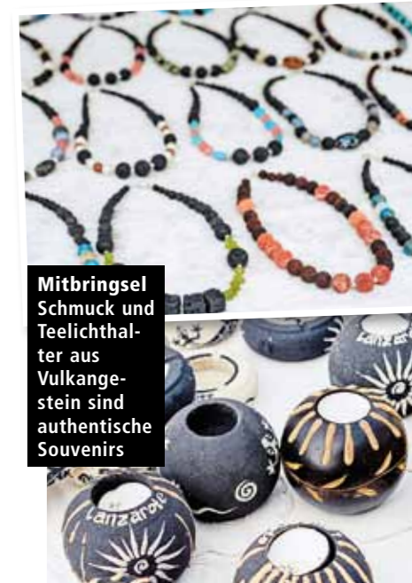
Mitbringsel Schmuck und Teelichthalter aus Vulkangestein sind authentische Souvenirs