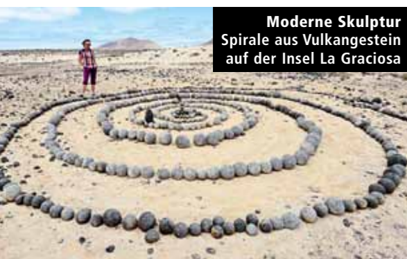
Moderne Skulptur Spirale aus Vulkangestein auf der Insel La Graciosa