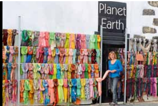
Auf Tuchfühlung In der ehemaligen Hauptstadt Tegui laden hübsche Läden in alten Häusern zum Einkaufen ein