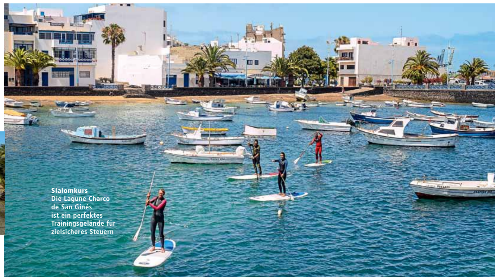
Slalomkurs Die Lagune Charco de San Ginés ist ein perfektes Trainingsgelände für zielsicheres Steuern